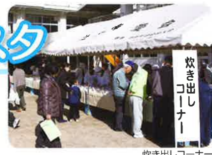
炊き出しコーナー

徳島県西部総合県民局・徳島県防災人材育成センター・三好市危機管理課・三好市社会福祉協議会・日本赤十字社・自衛隊徳島地方協力本部・三好警察署・みよし広域連合消防本部・三好市池田町消防団第3分団・四国電力・フレッセ・徳島三菱自動車・NTTフィールドテクノ・県西土木・箬蔵福祉村・箬蔵婦人会・じゅうやく会・でんがく会・地域と共に歩む会・箬蔵幼稚園・箬蔵小学校・池田支援学校