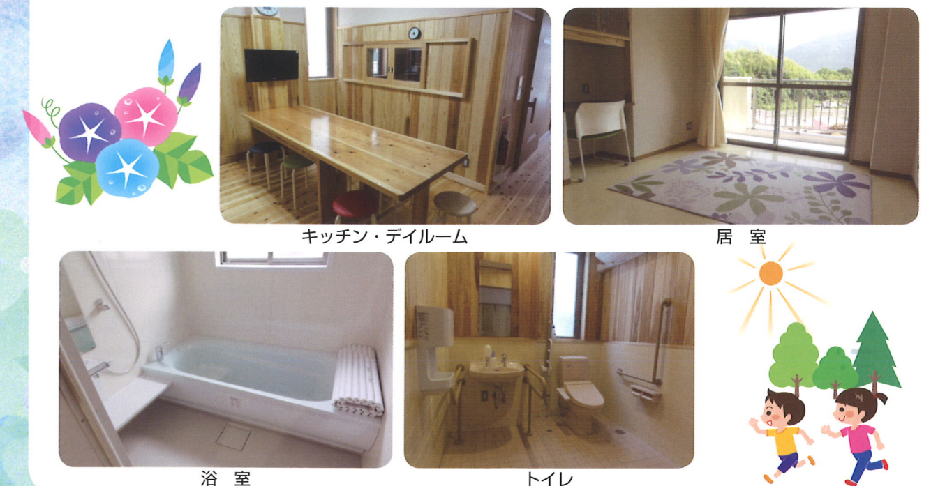
キッチン・ダイニング

小規模棟の建築にあたり、森林整備加速化・林業飛躍事業より補助金をいただいています。