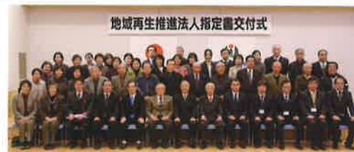
【写真中】指定書交付式に参加した関係者の方々